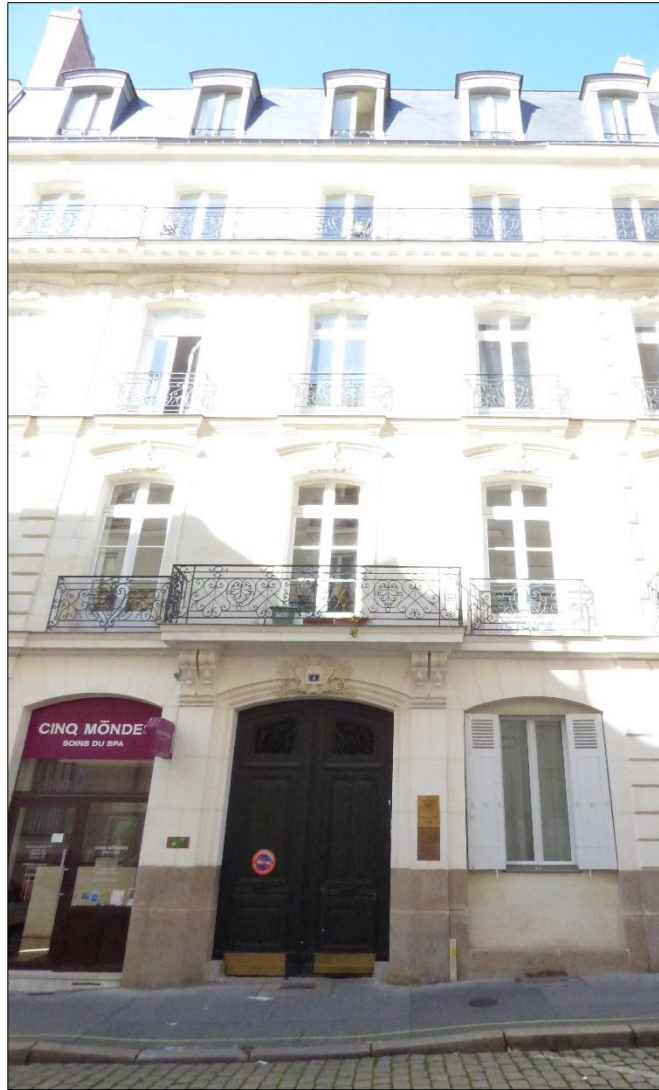
Façade de l'immeuble