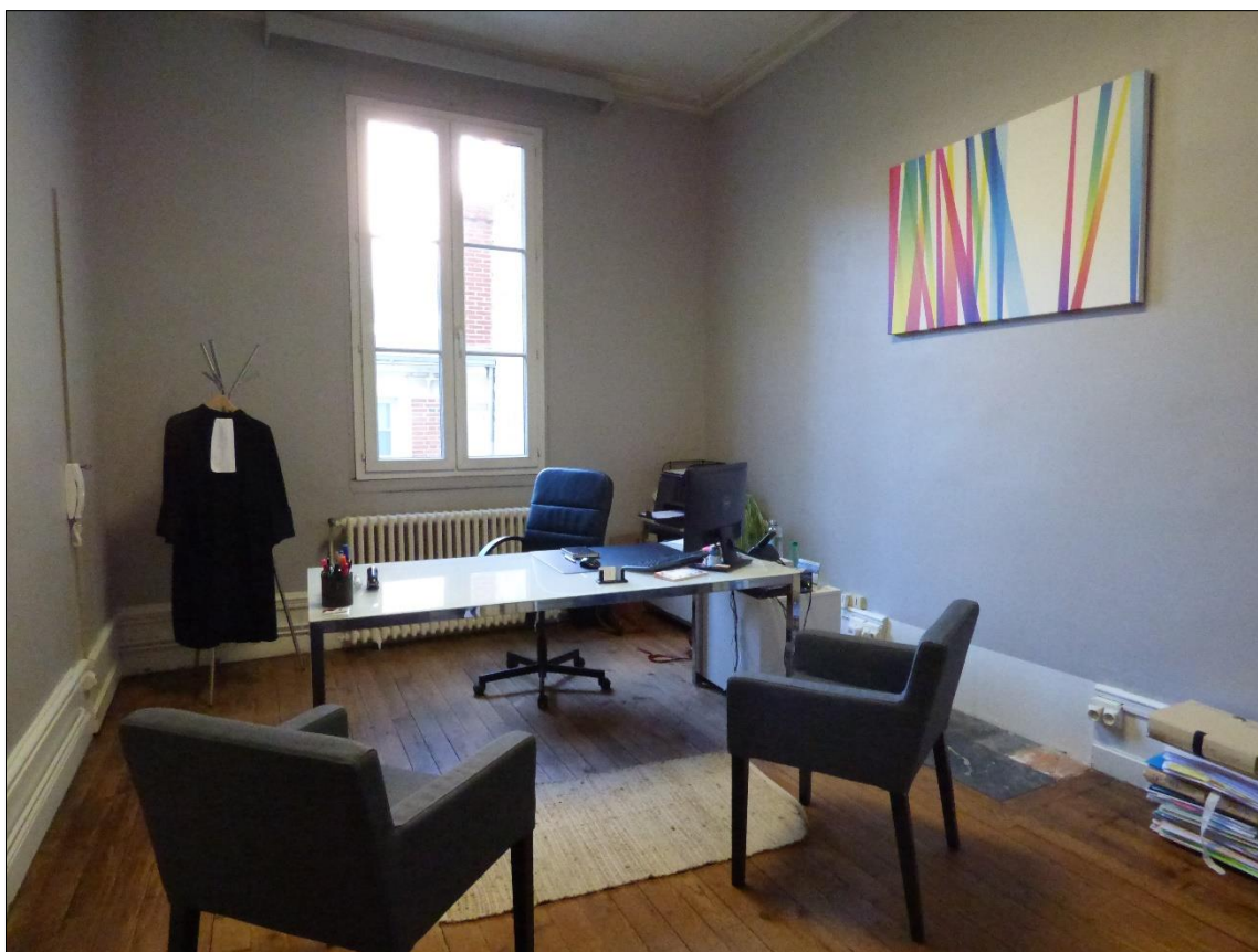
Bureau à louer

Isabelle LE FLOCH-CHAPLAIS (06.82.92.23.14)