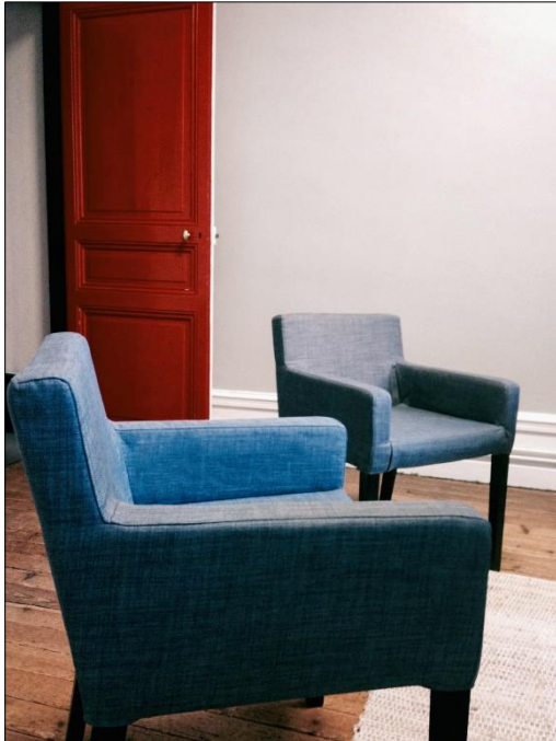
Entrée du bureau