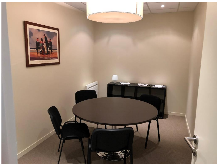
Petite salle de réunion