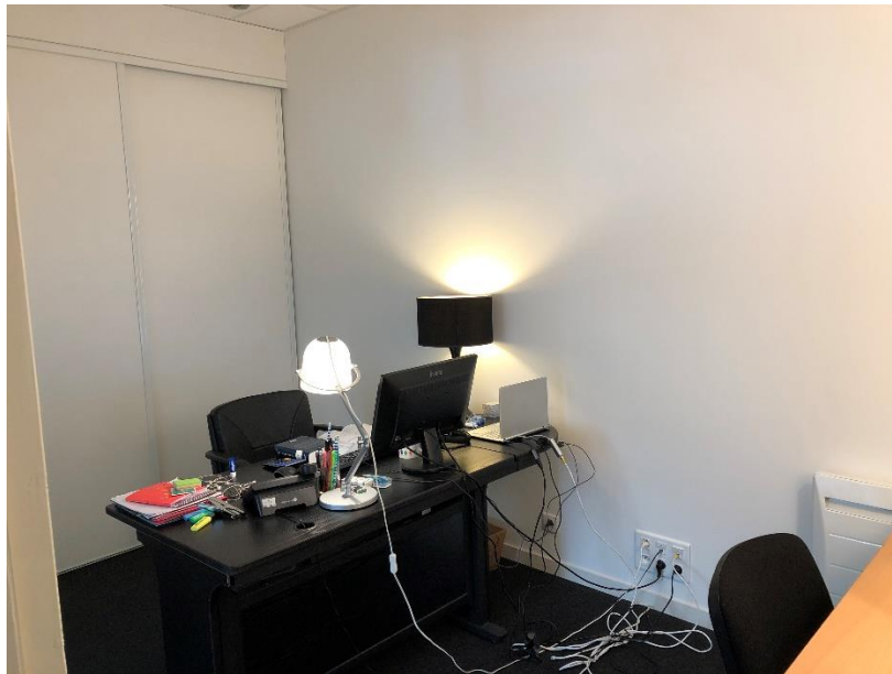
Bureau à louer