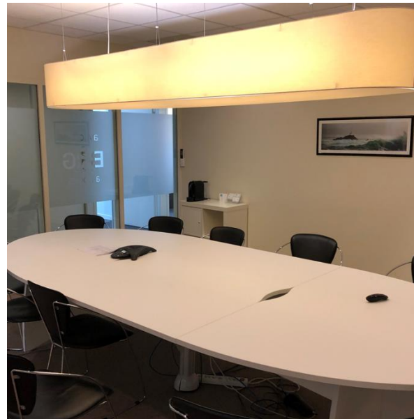
Grande salle de réunion