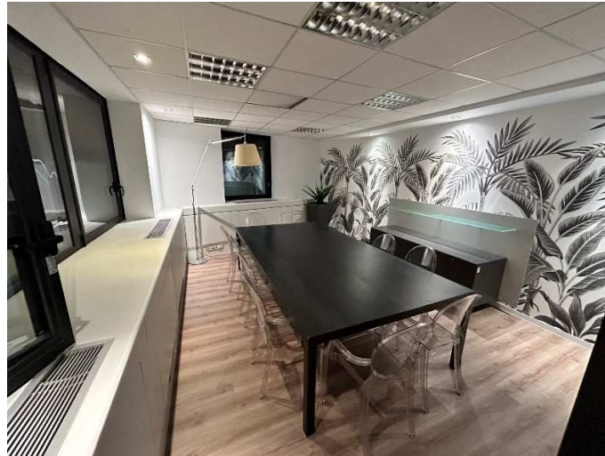
Salle de réunion 12 personnes