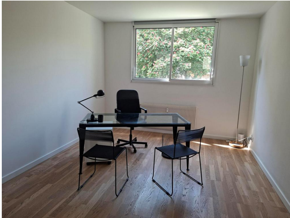
BUREAU N° 3 (16 m 2 )